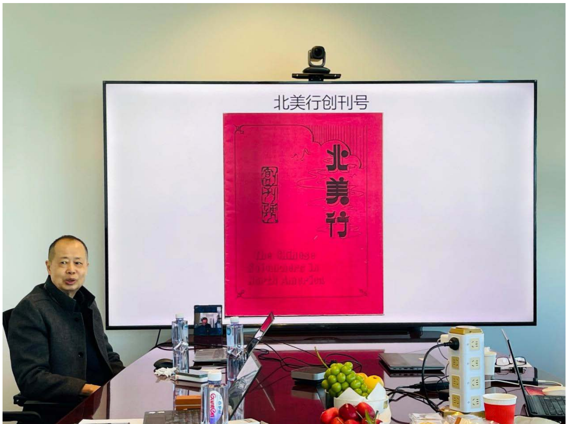
(何志工介绍《北美行》出版历史)